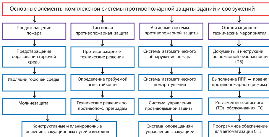
Рис. 1. Основные элементы комплексной системы противопожарной защиты зданий

Первая составляющая самая эффективная, так как главное – не допустить возникновения пожара. Если он все-таки возник, необходимо ограничить его распространение, предотвратить угрозу и обеспечить условия эвакуации людей, а затем приступить к тушению пожара. За реализацию первых двух задач отвечают системы пассивной противопожарной защиты, за третью – системы активной