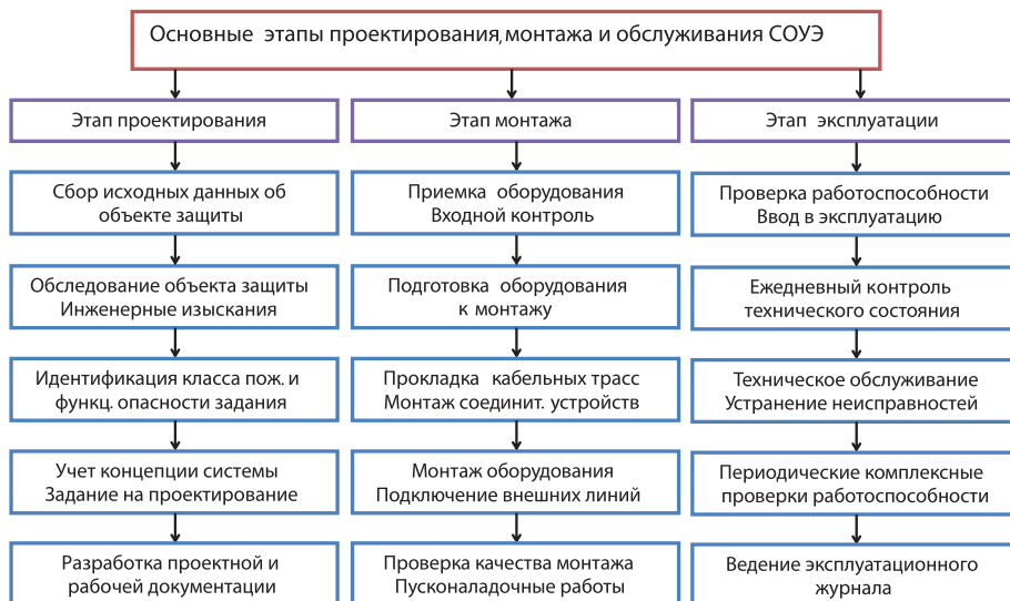
Рис. 2. Основные этапы жизненного цикла СОУЭ