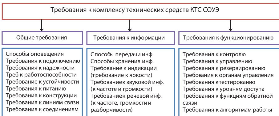
Рис. 4. Основные требования и классификация технических средств СОУЭ

Запуск аварийного сообщения возможен в автоматическом и в автоматизированном (полуавтоматическом) режимах. В автоматическом режиме прибор SX осуществляет прием сигналов от системы пожарной сигнализации (СПС / приборы ППКП) и запускает до 31-го заранее подготовленных и записанных на энергонезависимую память экстренных речевых сообщений, с возможностью их трансляции по пяти направлениям (линиям оповещения). В ручном (полуавтоматическом) режиме, управление может осуществляться при помощи органов управления прибора, комплектного тангетного микрофона или 4 удаленных микрофонных консолей ROXTON SX-R31 [9].